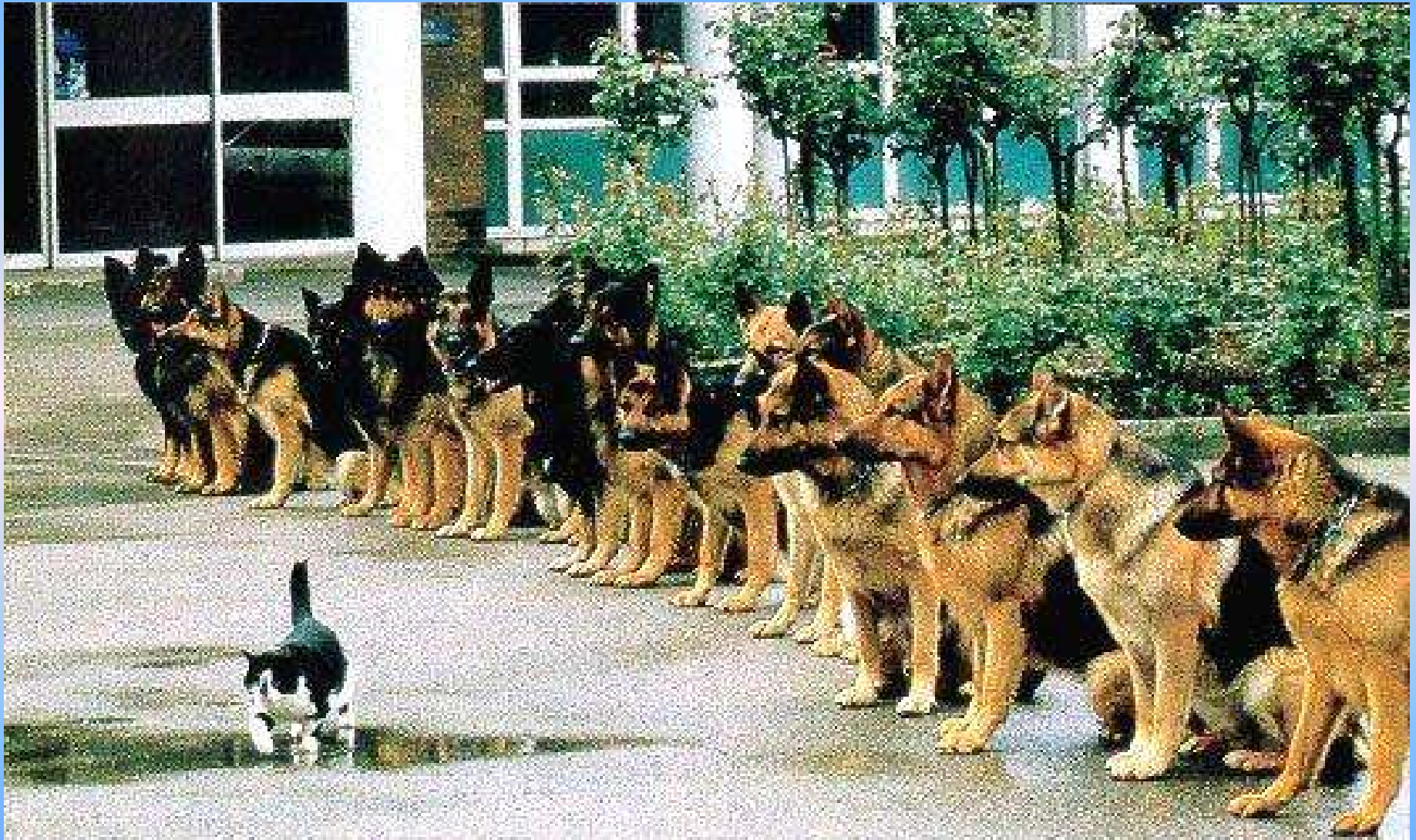
(Bestandteil einer Ausbildung zum Polizeihund)